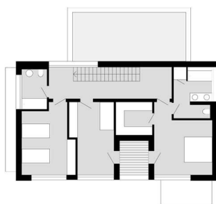
+ půdorys patra